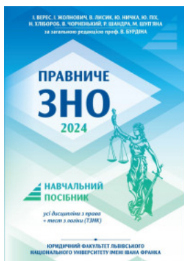
Правниче ЗНО 2024