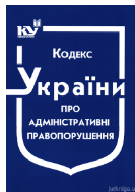
Кодекс України про адміністративні правопорушення