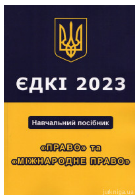
ЄДКІ 2023. Право та міжнародне право