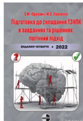
Підготовка до складання ТЗНПК в завданнях та рішеннях: логічний підхід