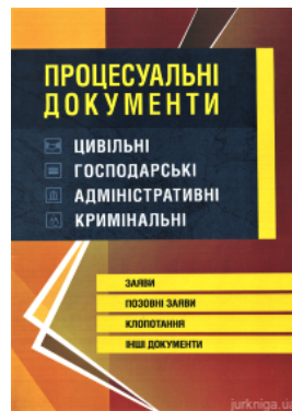
Процесуальні документи: цивільні, господарські, адміністративні, кримінальні. Заяви, позовні заяви, клопотання, інші документи