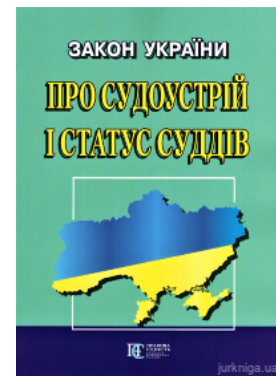
Закон України "Про судоустрій і статус суддів". Алерта