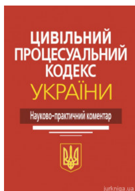
Цивільний процесуальний кодекс України: науково-практичний коментар