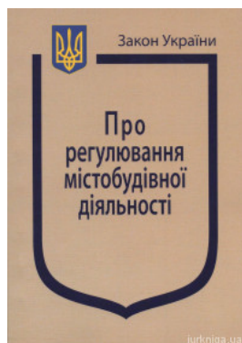
Закон України "Про регулювання містобудівної діяльності"