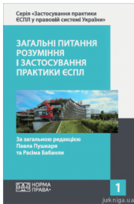
Загальні питання розуміння і застосування практики ЄСПЛ. Том 1