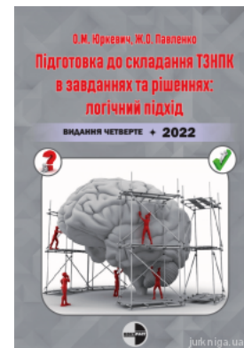
Підготовка до складання ТЗНПК в завданнях та рішеннях: логічний підхід