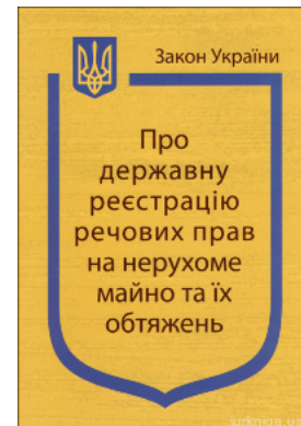
Закон України "Про державну реєстрацію речових прав на нерухоме майно та їх обтяжень"