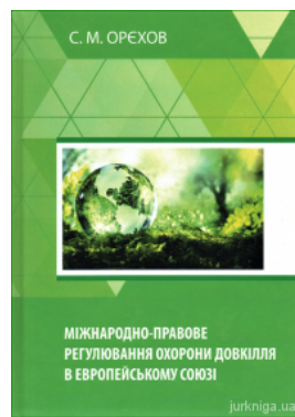
Міжнародно-правове регулювання охорони довкілля в Європейському союзі