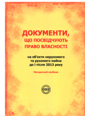
Документи, що посвідчують право власності на об'єкти нерухомого та рухомого майна до і після 2013 року