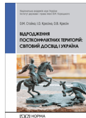
Відродження постконфліктних територій: світовий досвід і Україна