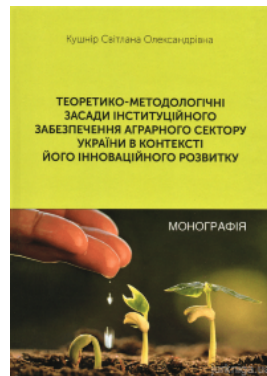
Теоретико-методологічні засади інституційного забезпечення аграрного сектору України в контексті його інноваційного розвитку