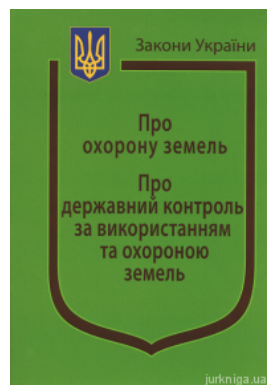
Закони України "Про охорону земель", "Про державний контроль за використанням та охороною земель"