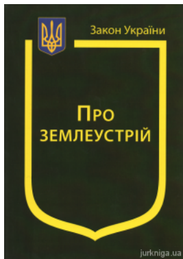
Закон України "Про землеустрій"