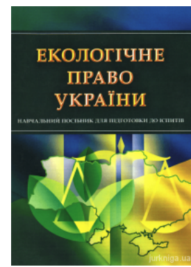
Екологічне право України. Навчальний посібник для підготовки до іспитів