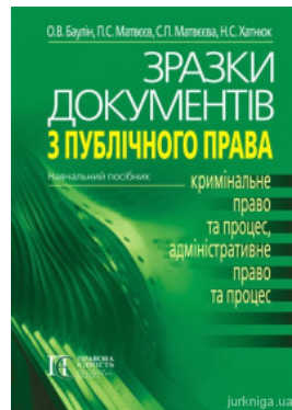
Зразки документів з публічного права (кримінальне право та процес, адміністративне право та процес)