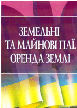
Земельні та майнові паї. Оренда землі.