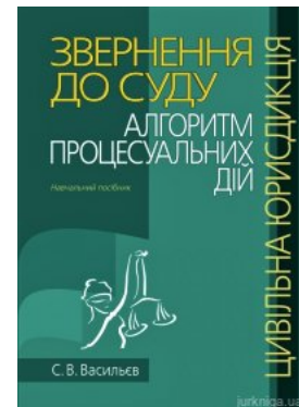
Звернення до суду: алгоритм процесуальних дій (цивільна юрисдикція)