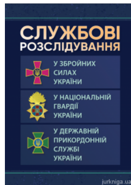
Службові розслідування: у Збройних Силах України, у Національній гвардії України, у Державній прикордонній службі України