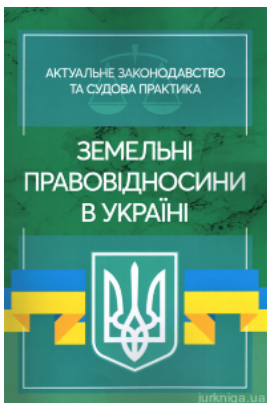
Земельні правовідносини в Україні. Актуальне законодавство та судова практика