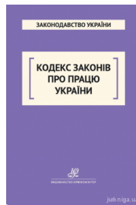
Кодекс законів про працю України. Юрінком Інтер