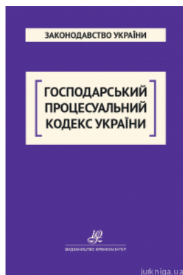
Господарський процесуальний кодекс України. Юрінком Інтер