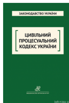
Цивільний процесуальний кодекс України. Юрінком Інтер