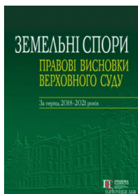
Земельні спори: правові висновки Верховного Суду за період 2018-2021 років