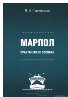
МАРПОЛ: практическое пособие