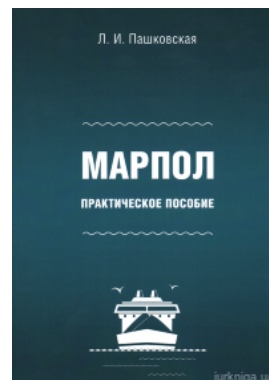
МАРПОЛ: практическое пособие