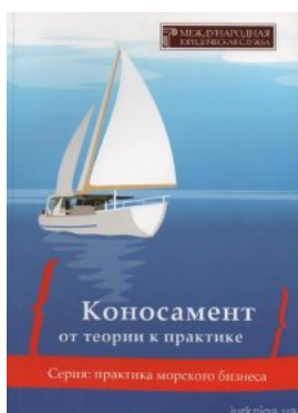
Коносамент: от теории к практике