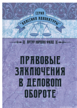
Правовые заключения в деловом обороте