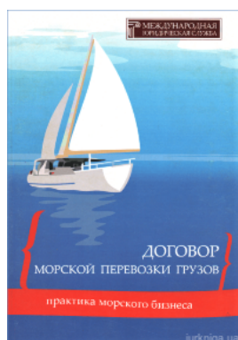
Договор морской перевозки грузов