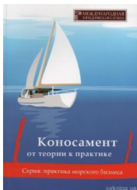
Коносамент: от теории к практике