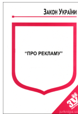
Закон України "Про рекламу"