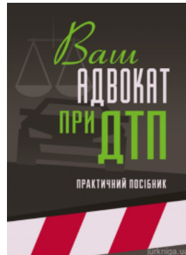
Ваш адвокат при ДТП