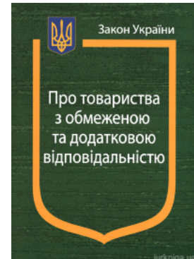
Закон України «Про товариства з обмеженою та додатковою відповідальністю»