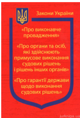
Закони України "Про виконавче провадження", "Про органи та осіб, які здійснюють примусове виконання судових рішень і рішень інших..."