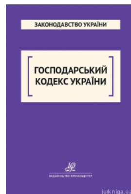
Господарський кодекс України. Юрінком Інтер

Перейти до галузі права Цивільне право та процес