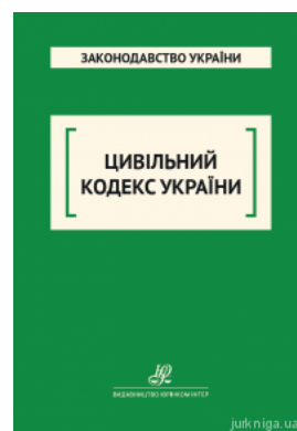
Цивільний кодекс України. Юрінком Інтер