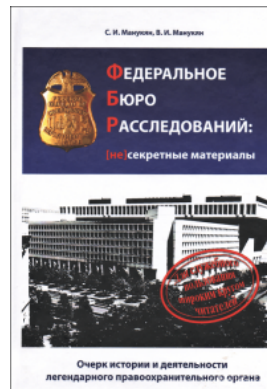
Федеральное бюро расследований: несекретные материалы. Очерк истории и деятельности легендарного правоохранительного органа