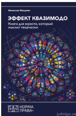
Эффект Квазимодо. Книга для юриста, который мыслит творчески