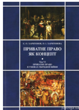
Приватне право як концепт. Том 6: Приватне право в умовах гібридної війни