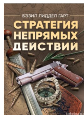
Стратегия непрямых действий

Перейти до галузі права Кримінальне право та процес