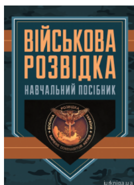
Військова розвідка. Навчальний посібник