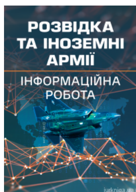
Розвідка та іноземні армії. Інформаційна робота