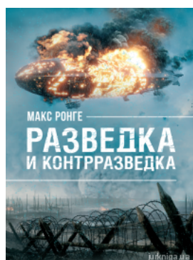
Разведка и контрразведка