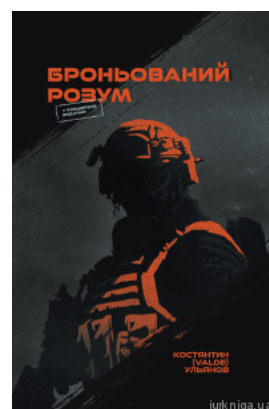
Броньований розум. Бойовий стрес та психологія екстремальних ситуацій