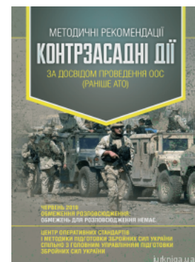
Методичні рекомендації "Контрзасадні дії" (за досвідом проведення ООС (раніше АТО))