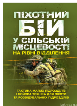
Піхотний бій. У сільській місцевості на рівні відділення. Тактика малих підрозділів і бойова техніка для піхоти та розвідувальних підрозділів