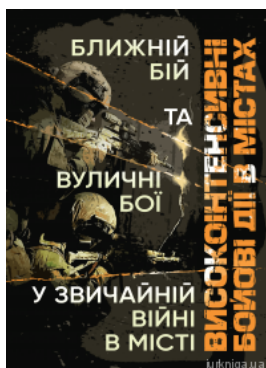
Високоінтенсивні бойові дії в містах. Близній бій та вуличні бої у звичайній війні в місті