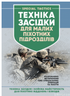
Техніка засідки для малих піхотних підрозділів