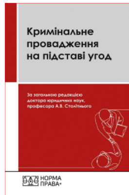
Кримінальне провадження на підставі угод. Третє видання