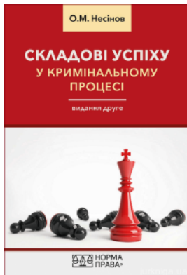
Складові успіху у кримінальному процесі. Видання друге