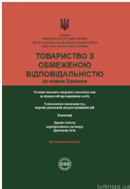
Товариство з обмеженою відповідальністю за новим Законом