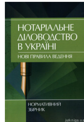
Нотаріальне діловодство в Україні. Нові правила ведення