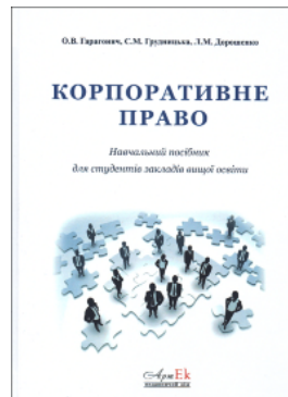
Корпоративне право: навчальний посібник