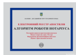
Електронний реєстр апостилів. Алгоритм роботи нотаріуса