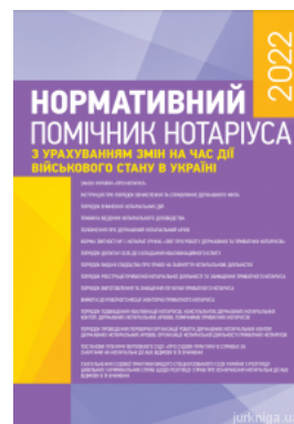
Нормативний помічник нотаріуса 2022

Перейти до галузі права Нотаріальне право