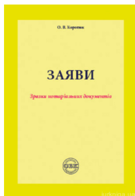
Заяви: зразки нотаріальних документів