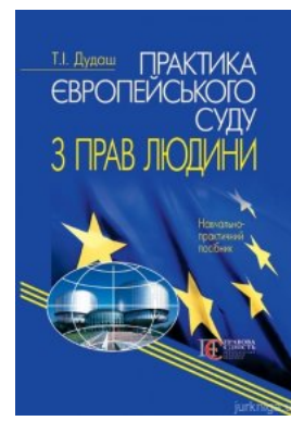
Практика Європейського суду з прав людини