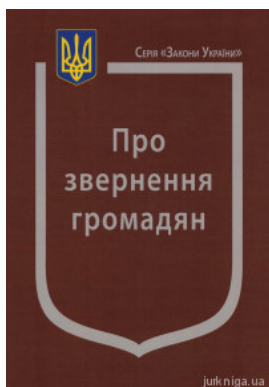
Закон України "Про звернення громадян"