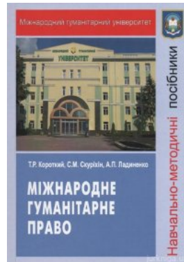
Міжнародне гуманітарне право. Навчально-методичний посібник