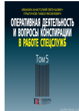
Оперативная деятельность и вопросы конспирации в работе спецслужб. Том 5