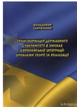
Трансформація державного суверенітету в умовах європейської інтеграції: проблеми теорії та реалізації