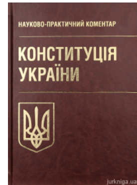
Конституція України. Науково-практичний коментар

Перейти до галузі права Міжнародне право