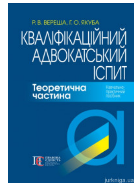
Кваліфікаційний адвокатський іспит. Теоретична частина