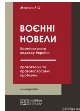
«Воєнні» новели Кримінального кодексу України: правотворчі та правозастосовні проблеми

Перейти до галузі права Кримінальне право та процес