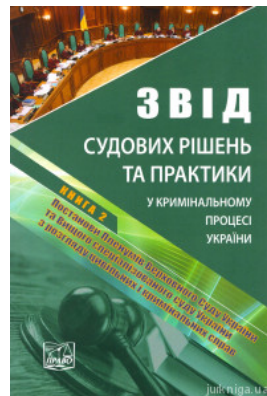
Звіт судових рішень та практики у кримінальному процесі України у 5-ти томах. Книга 2. Постанови Пленумів Верховного Суду України та Вищого...