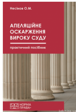
Апеляційне оскарження вироку суду. Практичний посібник