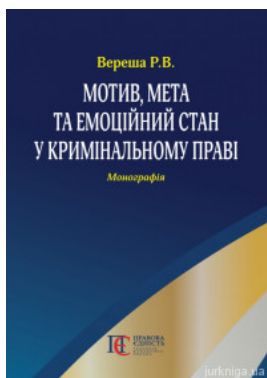
Мотив, мета та емоційний стан у кримінальному праві